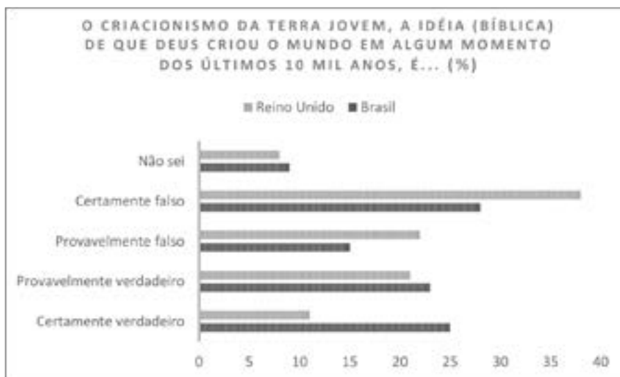
FIGURA 2: VISÃO DO GRUPO INVESTIGADO SOBRE A HIPÓTESE DO CRIACIONISMO DA TERRA JOVEM RELACIONADA À ESCOLARIDADE.

Nota-se, conforme apresentado na Figura 1, que no Brasil esta ideia é também bastante disseminada ao contrário do que foi sugerido em Colombo 13 de que provavelmente haveria uma maior tolerância entre os bra-